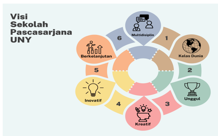
Gambar 2. Visi Sekolah Pascasarjana UNY

"Menjadi sekolah pascasarjana multidisiplin kelas dunia yang unggul, kreatif, dan inovatif berkelanjutan"